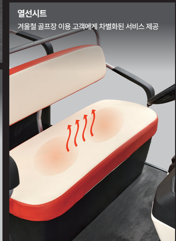
열선시트 겨울철 골프장 이용 고객에게 차별화된 서비스 제공