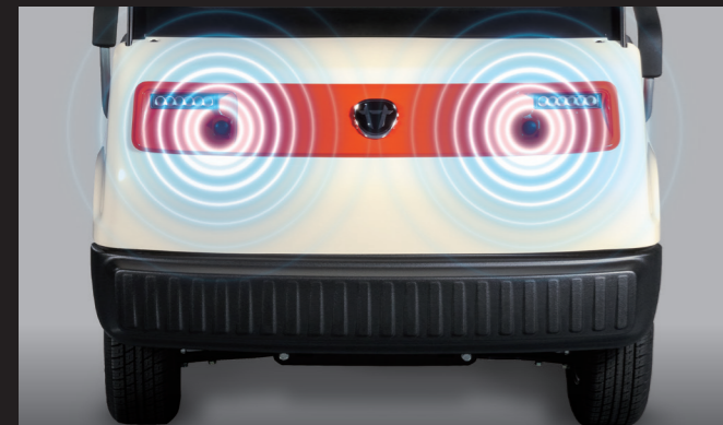
초음파 센서 전방에 2개의 초음파 센서를 장착해 인원 및 사물을 감지해 충돌 방지