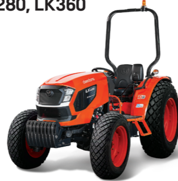
25 & 35마력 트랙터 LK280, LK360