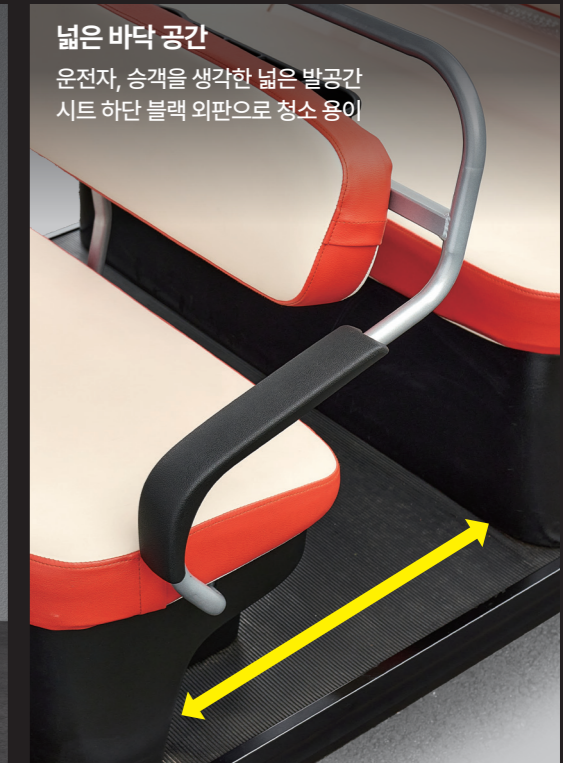
넓은 바닥 공간 운전자, 승객을 생각한 넓은 발공간 시트 하단 블랙 외판으로 청소 용이