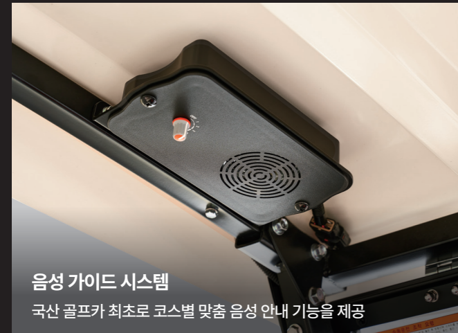
음성 가이드 시스템 국산 골프카 최초로 코스별 맞춤 음성 안내 기능을 제공