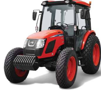
74마력 트랙터 RX730