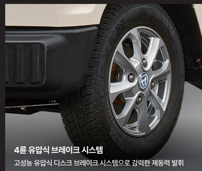
4륜 유압식 브레이크 시스템 고성능 유압식 디스크 브레이크 시스템으로 강력한 제동력 발휘