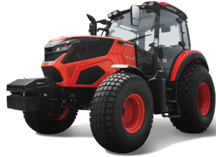
100마력 트랙터 HX900