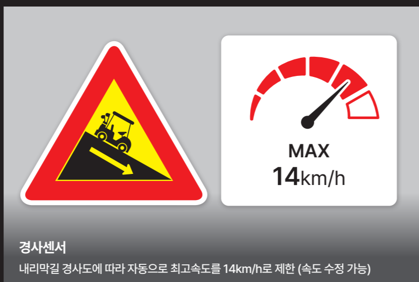
경사센서 내리막길 경사도에 따라 자동으로 최고속도를 14km/h로 제한 (속도 수정 가능)