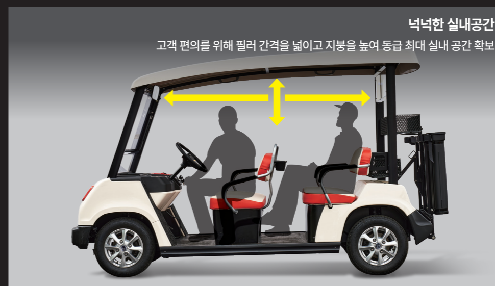
넉넉한 실내공간 고객 편의를 위해 필러 간격을 넓히고 지붕을 높여 동급 최대 실내 공간 확보